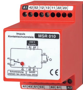
Relais de protection pour contacts type 905.12

Cela garantit une protection optimale des contacts et une fiabilité de commutation pour plusieurs millions de cycles de commutation.