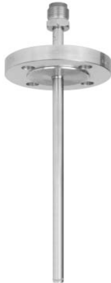
Защитная гильза с фланцем Модель SD200F