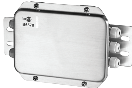
Распределительная коробка, модель B6578