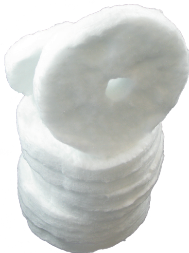
Уплотнительный диск, модель SD83